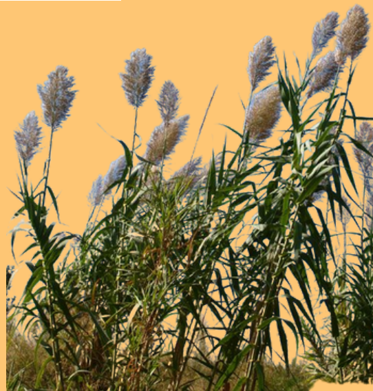
CAÑA COMÚN ( Arundo donax )