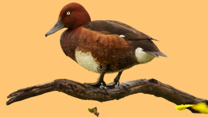
PORRÓN PARDO ( Aythya nyroca )