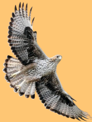
ÁGUILA PERDICERA ( Aquila fasciata )