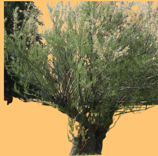
TARAY ( Tamarix africana )