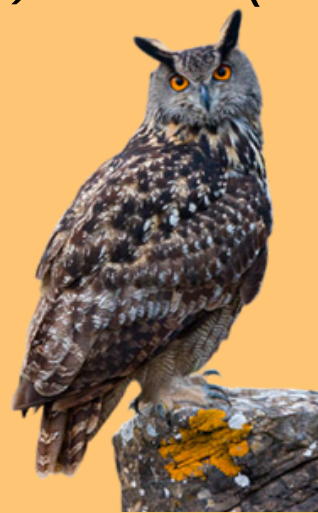
BÚHO REAL ( Bubo bubo )