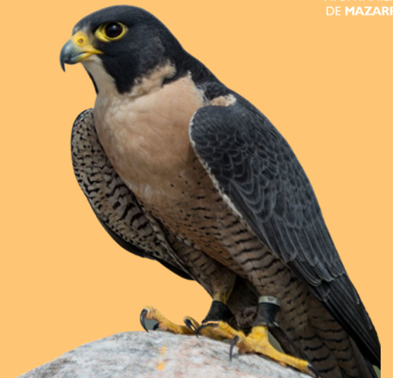
HALCÓN PEREGRINO ( Falco peregrinus )