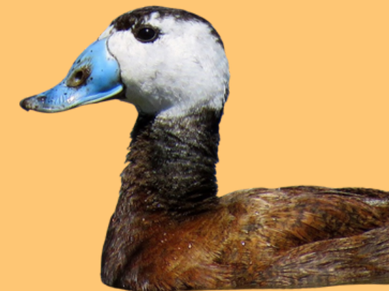
MALVASÍA CABECIBLANCA ( Oxyura leucocephala )