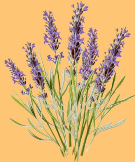
LAVANDA ( Lavandula )