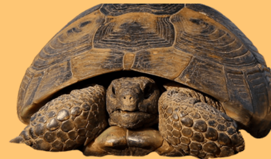
TORTUGA MORA ( Testudo graeca )